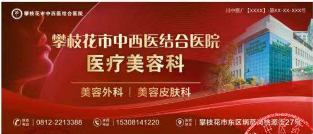
图 (3) 户外