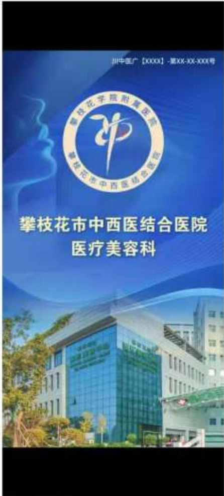
图 (1) 影视