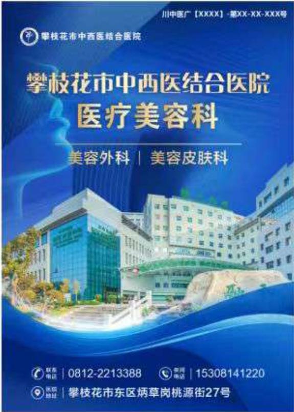
图 (4) 户外