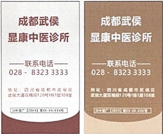
图 (5) 印刷品