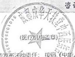
图 (1) 影视